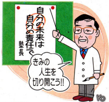
イラスト/小林隆一 SHIMOTSUKE GRAPHICS

ウカル 高校の卒業後のことまで、あまり考えていないのですが。 塾長 今どのような社会なのか、これが