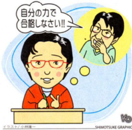
イラスト/小林隆一 SHIMOTSUKE GRAPHICS

自分の行きたい高校を自分にとっての「一流校」と考え、「一流校」合格に向けて受験生としての自覚をもって毎日を大切に過ごしましょう。