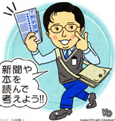
イラスト/小林 謙一 SHIMOTSUKE GRAPHICS

前の1〜2時間、朝少 し早く起きて、朝食ま での1〜2時間、確実 に机に向かうことで す。これだけでも3〜 6時間はできますよ。 学校が休みの日に は、学校の平日の授業 時間にあわせて昼間勉 強することがコツで す。夜は、7〜8時間 睡眠をとりましょう。 ウカル どのように 勉強したらよいのです