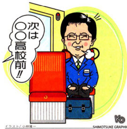
イラスト/小林博一 SHIMOTSUKE GRAPHICS

はありますか。 塾長 試験当日は、保護者や家族に「今日まで受験勉強を支えてください、ありがとうございました。元気に帰って来ます」と感謝の言葉を述べましょう。後は全力を出し切るのみです。ガンバレ！