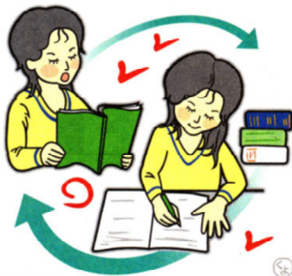
イラスト/伊藤貴代 SHIMOTSUKE GRAPHICS

1950年足利市生まれ。塾生数6500人、社員数350人と県内有数の規模の学習塾・開倫塾塾長。CTR T栃木放送で「開倫塾の時間」を担当。宇都宮大学大学院客員教授、マニーマニ社取締役などを務める。