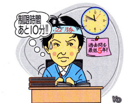
イラスト/小林隆一 SHIMOTSUKE GRAPHICS