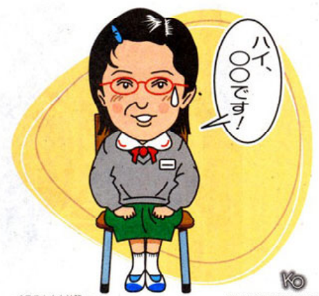
イラスト/小林雄一 SHIMOTSUKE GRAPHICS

時間が足りず解答できなかった場合は、問題練習を繰り返して、解答スピードを上げること。問題の内容自体がよく理解できなかった場合は学校の教科書や