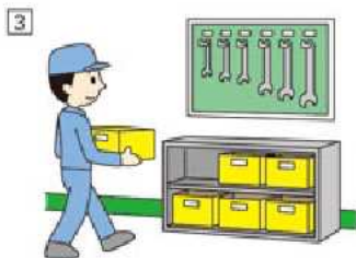
「整頓(seiton)」 ものと同じところに置く