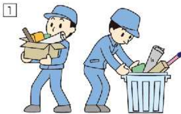
「整理(seiri)」 不要なものは処分する