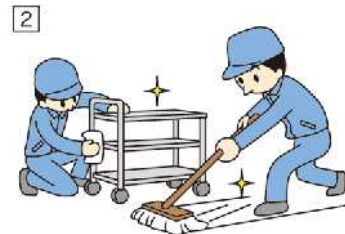
「清掃(seisou)」 きれいに掃除をする