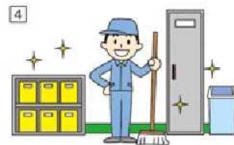
「清潔(seiketsu)」 ----- ①~③を継続する