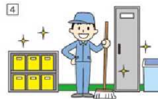
「清潔(seiketsu)」 ----- ①~③を継続する