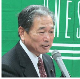
栃木県議会議員 斉藤具秀氏