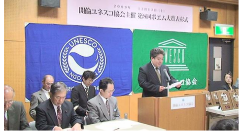
衆議院議員茂木敏充 薄井伸之秘書