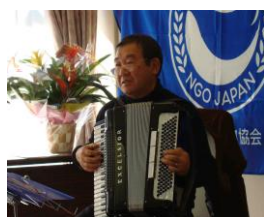
アコーディオン演奏