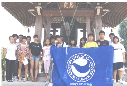
永宝寺での「平和の鐘を鳴らそう運動」の様子