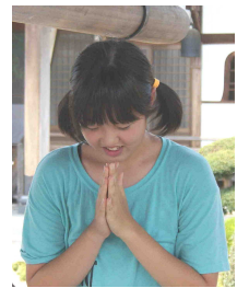
永宝寺で平和を祈る参加者