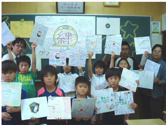
大船渡ユネスコ協会へお贈りした「メッセージボード」

United Nations Educational, Scientific and Cultural Organization (UNESCO)