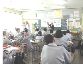
足利市立山辺中学校の授業