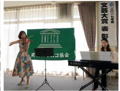
百万人のクラシックライブ