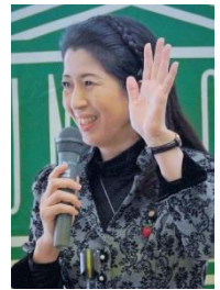
上野通子 参議院議員