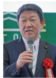
経済再生担当大臣 茂木敏充衆議院議員